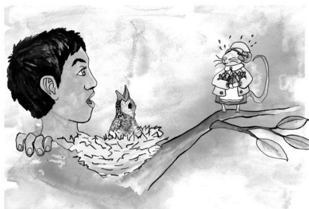
Twee illustraties uit het boek.

teerde (met of zonder kinderen) in huis te willen hebben. In twee lieve verhalen wordt adoptie uitgelegd en dat maakt het boekje zeer geschikt als startpunt om met kinderen in gesprek te gaan over adoptie. De enige kanttekening die ik wil maken: de tekst over de adoptie van mama is wel heel speciaal gericht op de situatie en de achtergronden van de schrijfster. Het zou kunnen zijn dat het voor geadopteerden met een ander adoptieverhaal minder als illustratie daarvoor gebruikt kan worden. Zelf zou ik er de voorkeur aan hebben gegeven als het dierenverhaal eerst was verteld en het "mama"verhaal iets neutraler verwoord zou zijn.